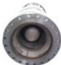
Silencieux réseau surpressé

SPECTRA vous accompagne en amont : études avant projet et préconisations de solutions acoustiques pour l'ensemble de vos équipements et locaux techniques, industriels ou tertiaires (locaux surpresseurs, locaux groupes électrogènes,...)