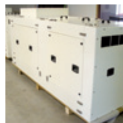
Capotage pompe à lobes